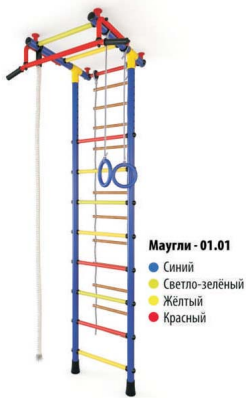
????????? ?????????????? ?????????? ??? ??? ????-01.01